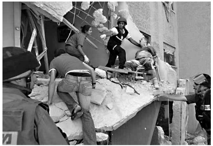
Zerstörung, Tod und Trauer in der libanesischen Hafenstadt Tyrus (links). Aber auch Israel hat viele Opfer zu beklagen, hier in Haifa.

Meer der libanesischen Innenpolitik. Israel versucht konsequenterweise, das Kalkül des Hizbullah zu unterlaufen, dass es in einen langwierigen und für eine Armee nicht zu gewinnenden Kleinkrieg verwickelt wird.“